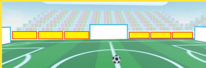
フィールドバナー 掲載予定エリア